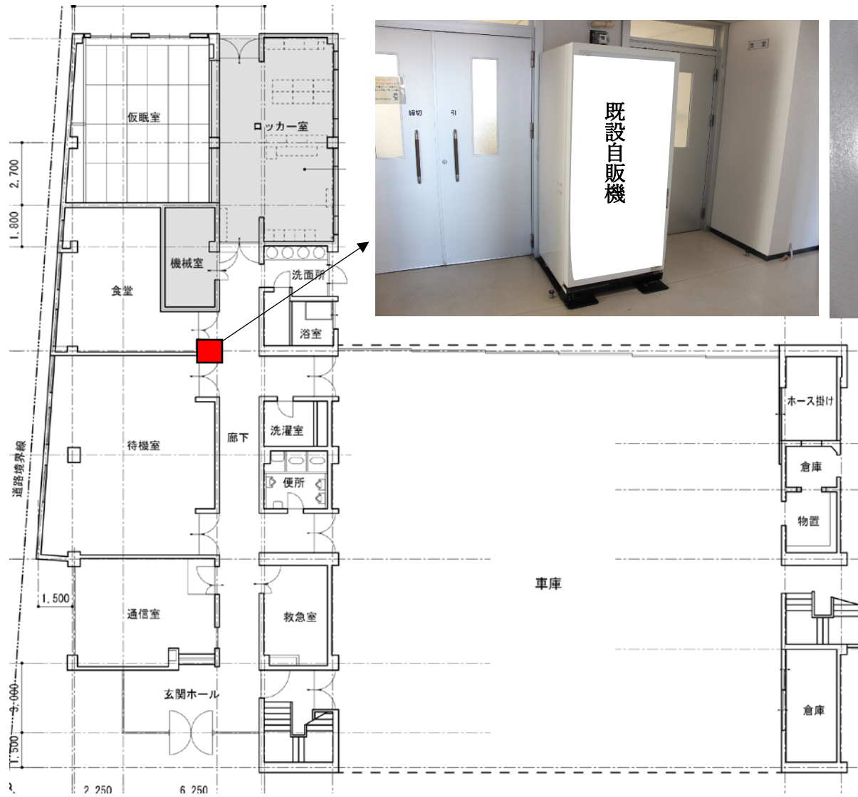
配置図（消防本部1階平面図）