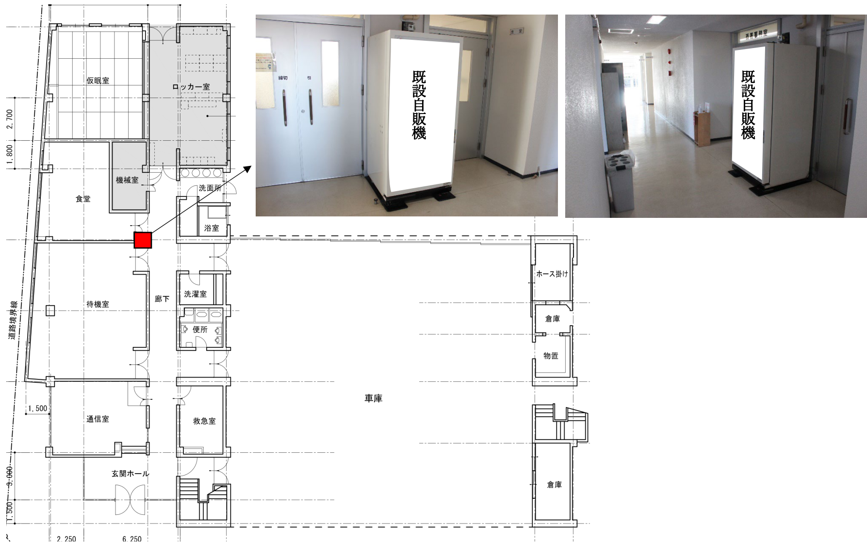
配置図（消防本部1階平面図）