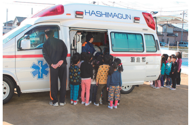
▲ 消防車や救急車を見学しました。