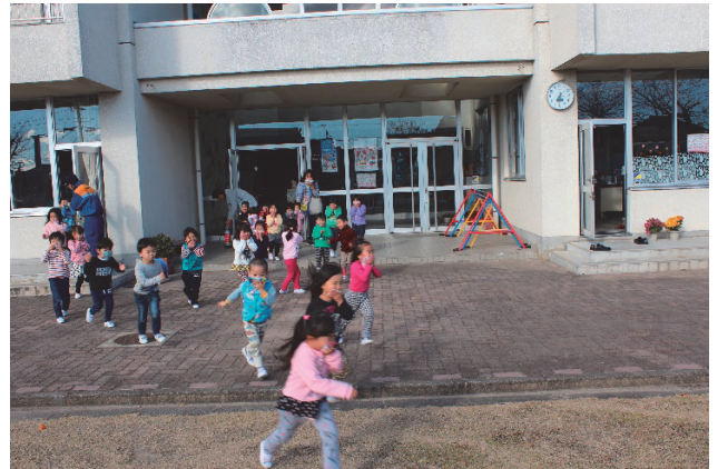
▲ 避難訓練をしました。

幼年消防クラブは、幼年期における正しい火災予防の知識としつけを身につけ、各園・家庭等からの火災の減少を図るとともに、将来、人命を尊重し、財産の保全を図る社会人としての素地を養育することを目的としています。