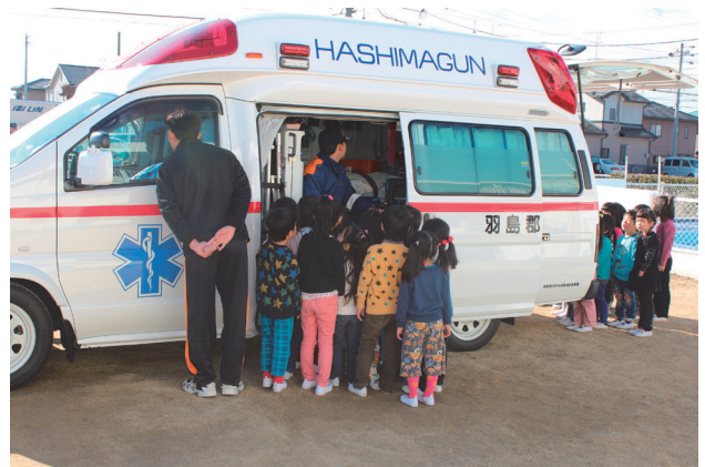
▲ 消防車や救急車を見学しました。