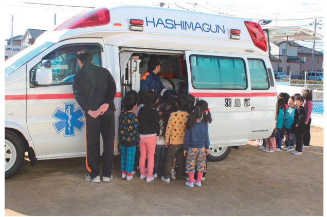
▲ 消防車や救急車を見学しました。