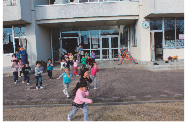
▲ 避難訓練をしました。

幼年消防クラブは、幼年期における正しい火災予防の知識としつけを身につけ、各園・家庭等からの火災の減少を図るとともに、将来、人命を尊重し、財産の保全を図る社会人としての素地を養育することを目的としています。