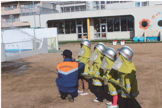
▲ 子供用防火衣を着て放水体験をしました。